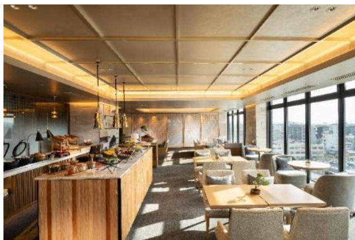
エグゼクティブラウンジ

日当たりの良い部屋からは新幹線の往来の眺めと一緒に北側の京都の街が一望できます。また、スイートルーム 3 室のうち 1 室は「畳スイートルーム」として、日本文化に興味があるお客様にご満足いただける和スタイルの客室をご用意しました。最上階 9 階に位置する、エグゼクティブルームおよびスイートルームにご宿泊のお客様のみがご利用いただけるエグゼクティブラウンジでは、チェックイン、チェックアウト、朝食、リフレッシュメント、イブニングカクテルなどのサービスをご提供いたします。