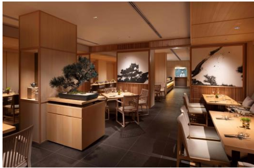
オールデイダイニング

宿泊のお客様には 24 時間営業のフィットネスセンターや大浴場も無料でご利用いただけます。