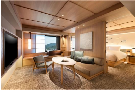
客室「キングデラックススイート」

61 平米のスイートルーム(2 室)には、バスルーム内にプライベートサウナやレインシャワーを備えています。また、京都出身の彫刻家の茶器や西陣織のファブリックアート、鴨川の水の流れをイメージした彫刻アートなどで京都の伝統や職人の技術をお客様が視覚で体験できる空間を演出しました。