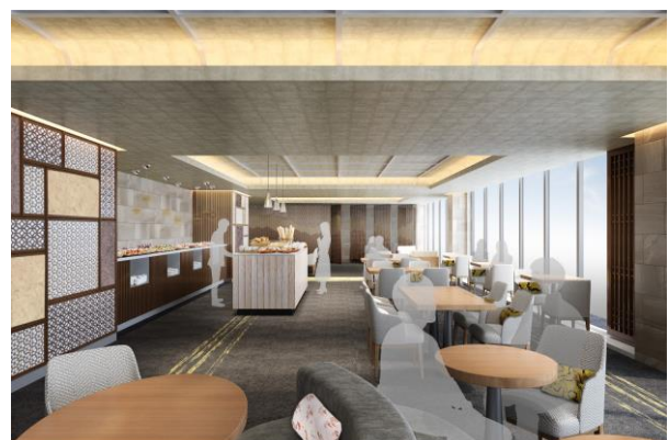
エグゼクティブラウンジ