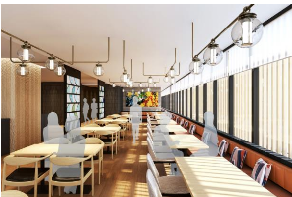
オールデイダイニング