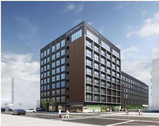
ホテル外観(イメージ)